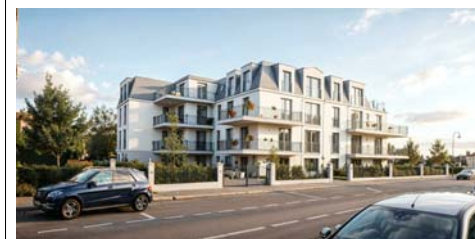
VILLA OP'ART Rue Abbé Enjalvin - 92160 ANTONY