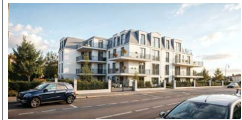
VILLA OP'ART Rue Abbé Enjalvin - 92160 ANTONY