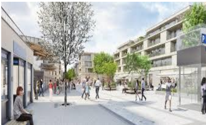
Place Patrick Devedjian

À seulement 8 km de la Porte d'Orléans, à proximité des pôles dynamiques d'Orly et de Rungis, cette adresse conjugue avec rareté l'élégance d'une atmosphère paisible et la vitalité d'un centre-ville parfaitement connecté. Commerces de qualité, établissements scolaires reconnus, équipements culturels et infrastructures sportives sont accessibles en quelques minutes à pied.